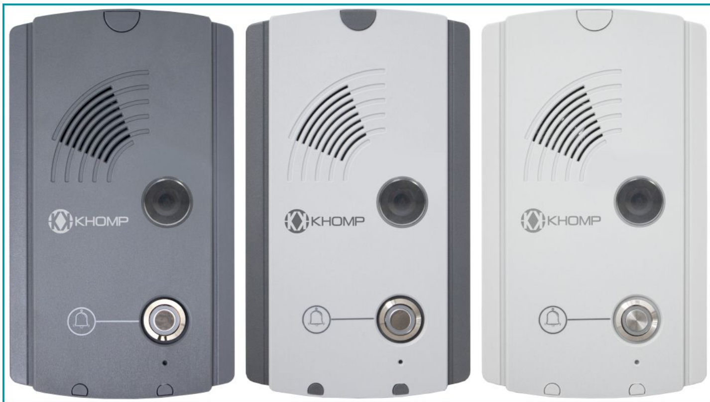
Legenda: Modelos do IP Intercom 101 DG - C, IP Intercom 101 BC - C e IP Intercom 101 LG - C.