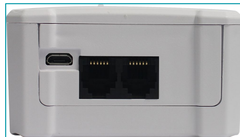
Subtítulo: Imagen frontal y de las conexiones del LoRa®.