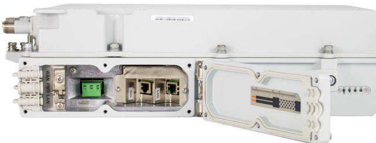
Visão das conexões e LEDs