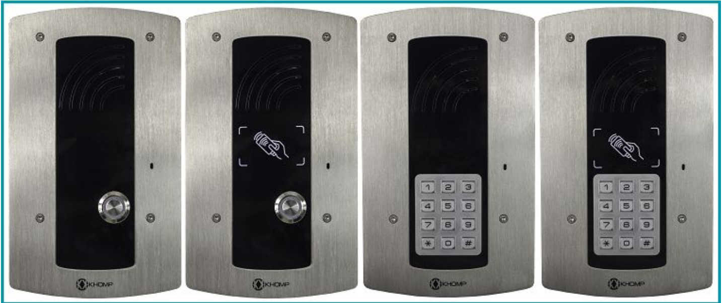
Leyenda: Frontal de los modelos IP Wall 301 S e IP Wall 312 S (ejemplos sin lector y con lector RFID integrado).