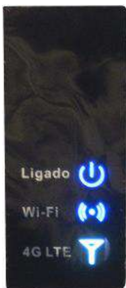
Visão dos LEDs encontrados na parte frontal