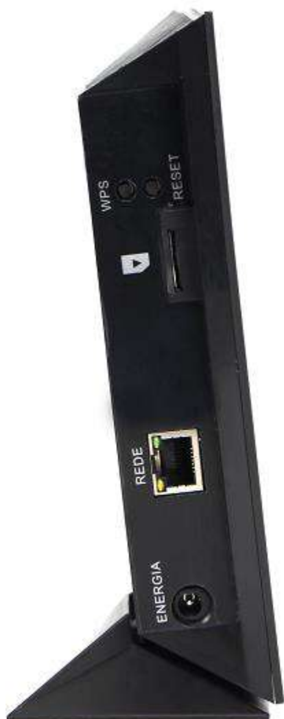
Visão da lateral esquerda