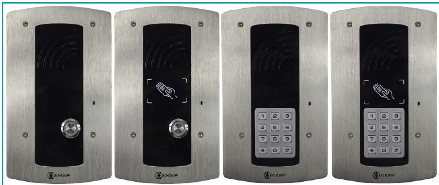
Legenda: Parte frontal dos modelos IP Wall 301 S e IP Wall 312 S (exemplos sem leitor e com leitor RFID integrado).