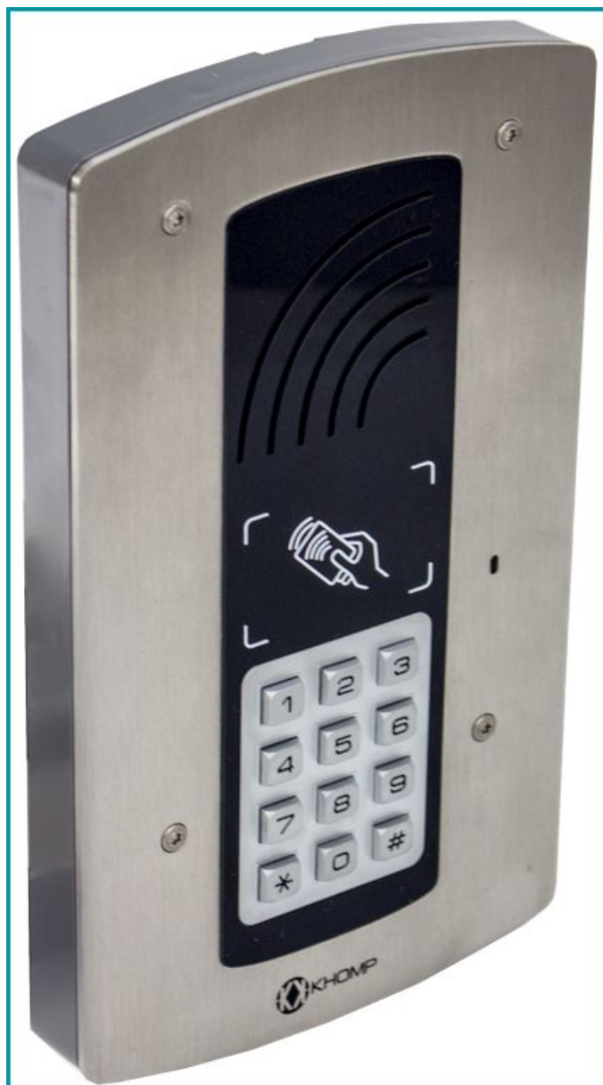
Legenda: Visão lateralizada dos modelos IP Wall 301 SR e IP Wall 312 SR (respectivamente).