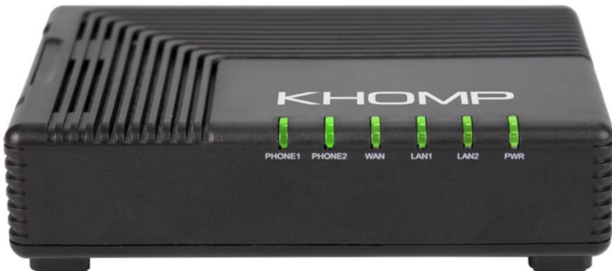
Visão frontal com LEDs indicadores.