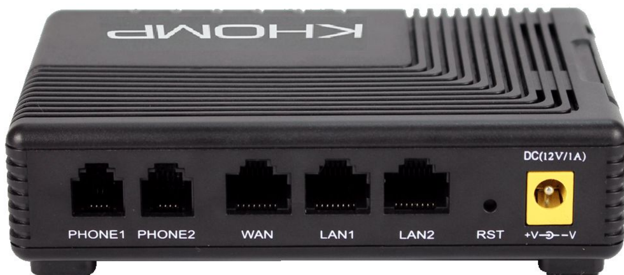
Visão traseira com portas FXS, portas WAN e LAN, botão de reset e entrada para fonte de energia.