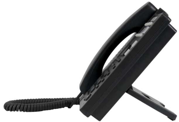
Posição de apoio para mesa