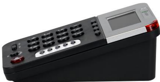
Posição de apoio de mesa