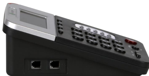
Visão lateral com interfaces para headset