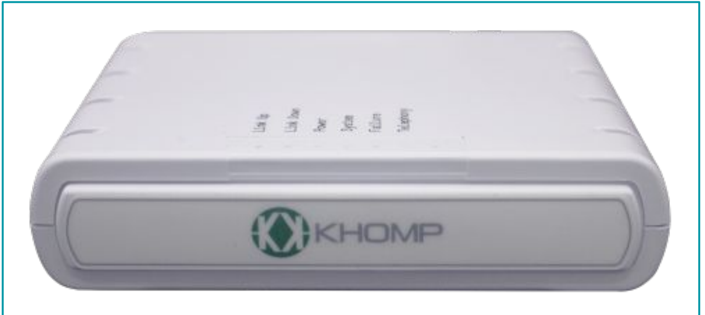
Leyenda: Vista frontal.