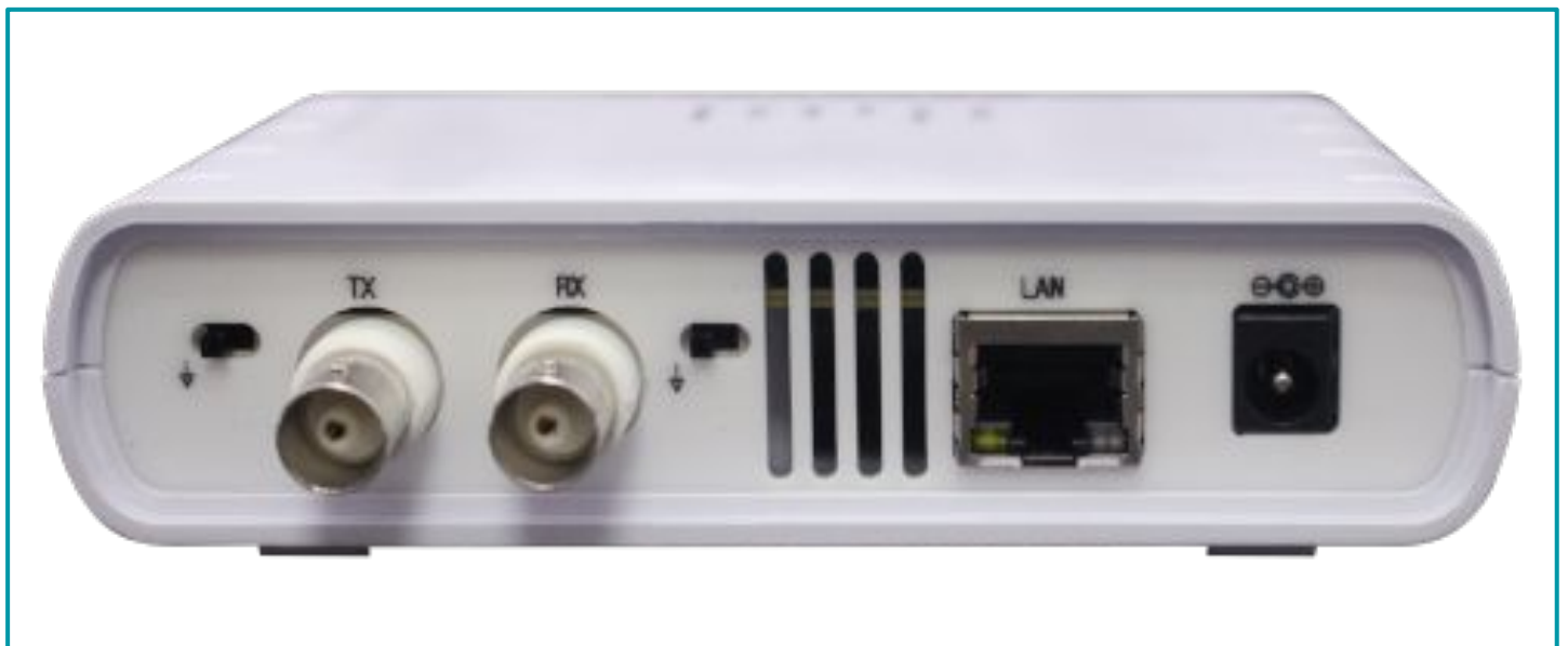
Leyenda: Vista posterior, enlace E1 con conector BNC coaxial.