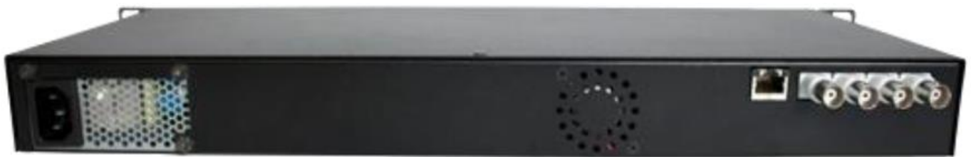
Vista posterior do modelo com 2 links E1