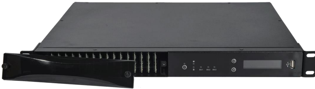
Vista frontal con la tapa abierta para cambiar las tarjetas SIM