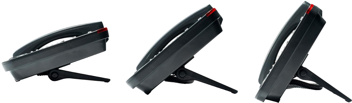
Posições de apoio para mesa.