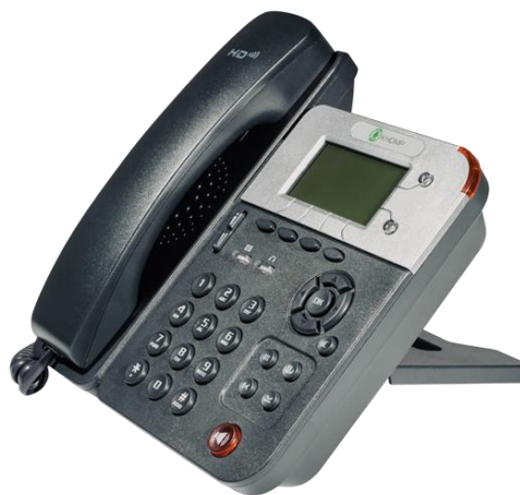
Outra posição de apoio para mesa.